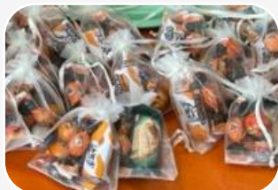
40 WORECZKÓW Z CUKIERKAMI