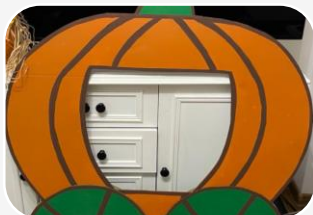
1 DYNIOWA KAROCA