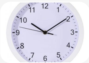
Czas kilkunastu osób 😊