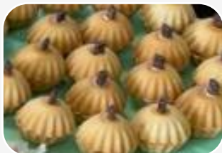
25 BABECZEK DYNIOWYCH