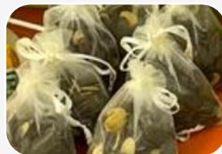
10 WORECZKÓW DYNIĄ