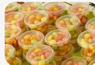
40 PUDEŁEK CHRUPEK